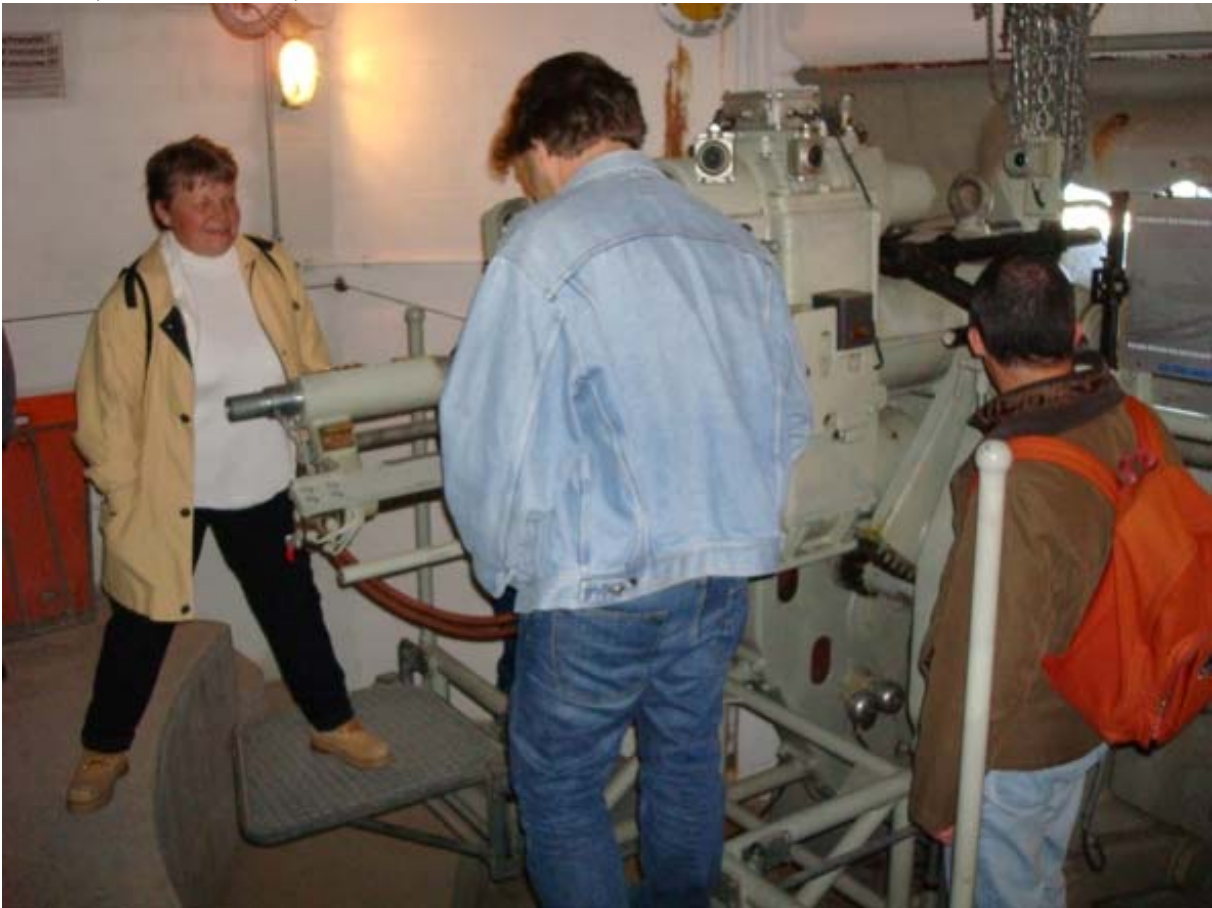
und von innen