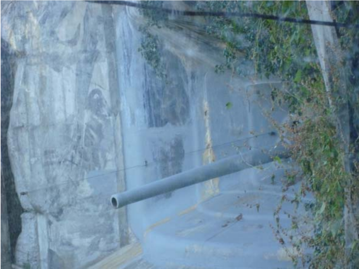
Die 10,5 cm Kanone, von aussen