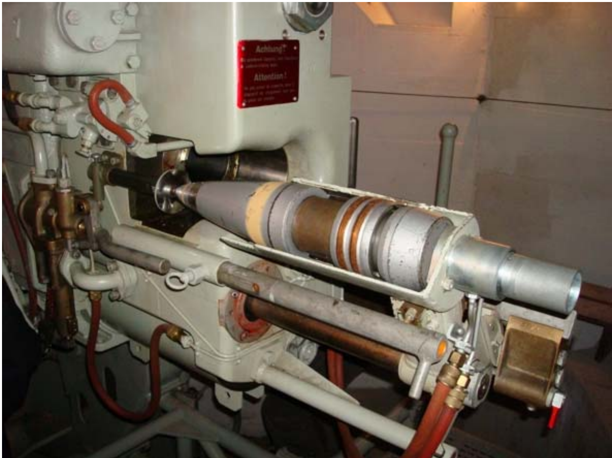
Die Ladevorrichtung der Kanone